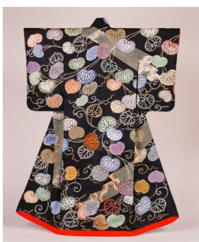
黒緞子地葵に御簾模様打掛（11月8日から）