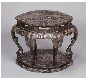
螺鈿楼閣人物図高卓（清時代）

尾形光琳・乾山の兄弟合作の角皿です。弟の尾形乾山が作陶した角皿に、兄の光琳が五重塔を絵付けしたものです。同様の作風の角皿は、国立博物館等にも所蔵されており、同時期に作られた1枚と考えられています。