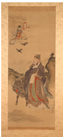
牽牛織女図（慶応元年）