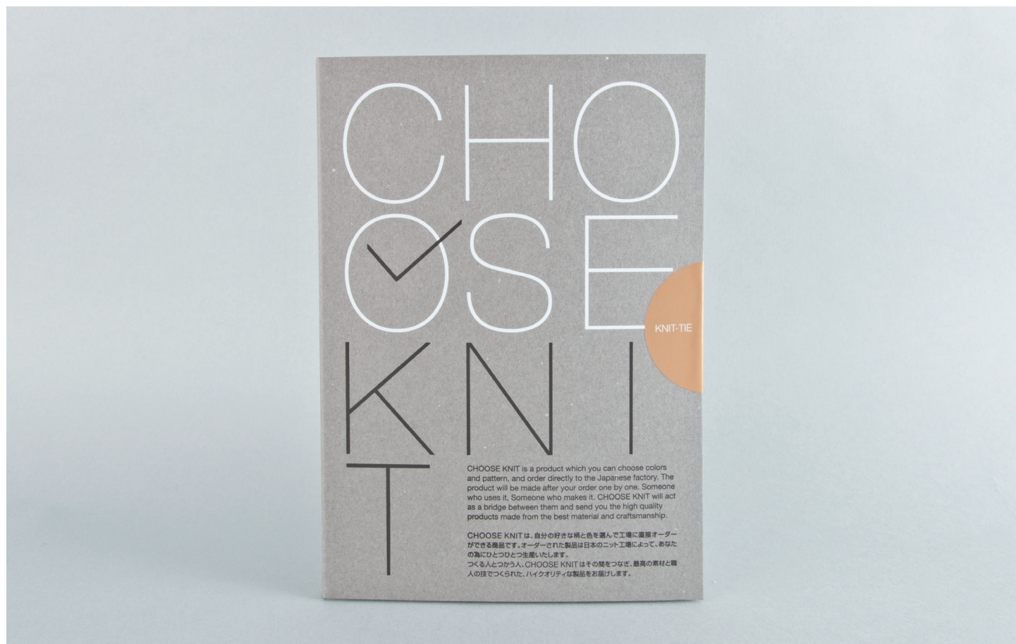
↑ EDITON 毎に異なる BOOK を贈ることで、もらった人は好きな柄と色でオーダーが可能

自分の好きな色と柄で工場に直接オーダーができる。BOOKで贈る、新感覚ギフト登場！