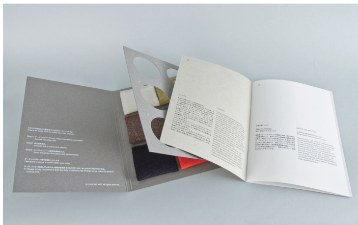
↑ BOOK には EDITION 毎に異なるブックレットが付きまます。

大切な誰かへの贈り物にはもちろん、ご自分のとっておきの 1 つをオーダーするためにもご利用いただける新しいギフトのカタチを CHOOSE KNIT は提案します。