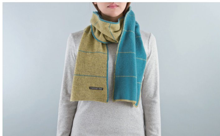
↑ MUFLER EDITION の仕上がり製品例