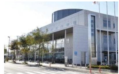
西区役所/西区保健センター 徒歩5分