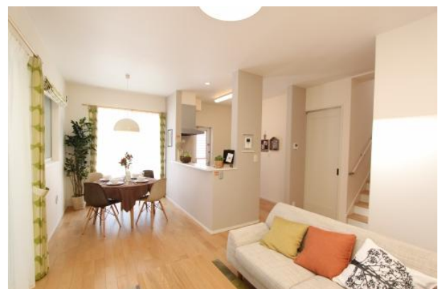
天井高 2.7m の開放的なリビング・ダイニング

設備も毎日使う場所だからこそ、機能性と美しさ両方を兼ね備えながら、ずっと永く暮らすための快適さを追求。ハイオープンなキッチンや豊富な収納スペースなどを用意しました。天井高 2.7m の開放的なリビング・ダイニングやスタディカウンター、お掃除のしやすさに配慮したサニタリーなど、家族が暮らしやすい機能を備えています。