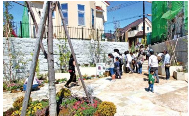
「みんなで植栽の名前を理解して管理に役立てよう」※2013年4月撮影

『結美の丘』では、草花や樹木など身近な自然に興味や理解を深めてもらい、やがては自分たちの暮らす街の一部として緑を守っていく意識を育むために、園芸のプロを招いて人々が気軽に参加できるようなグリーンワークショップを開催していきます。ここに住まう人が自ら植物を育て、景観を育てる楽しみを味わえるようサポートします。