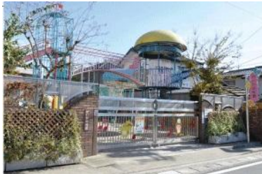
せいか幼稚園 徒歩8分