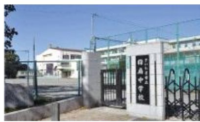
指扇中学校 徒歩3分