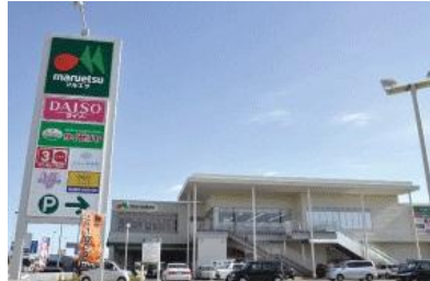
マルエツ西大宮駅前店 徒歩7分