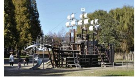
三橋総合公園 徒歩32分