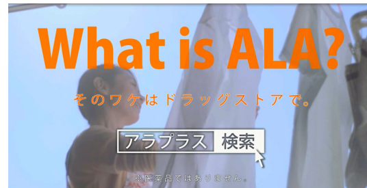
女性 (家事) 篇