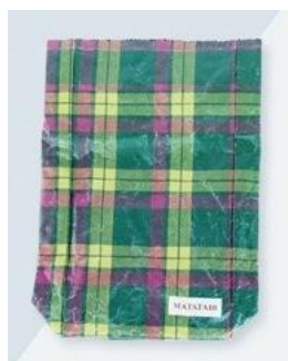
<MATATABI> ベーカーリーバッグ 6,480円