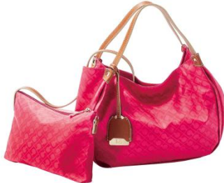
三越銀座店限定 <ゲラルディーニ>ハンドバッグ 45,360円 ■1階 ハンドバッグ

今年で130周年を迎えるブランドから、青空に映える鮮やかなピンクカラーが登場。便利なバックインバッグ付きです。