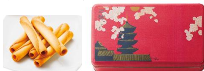
三越銀座店限定 <ヨックモック>プティシガール銀座限定記念缶 1,296円 ■地下2階 洋菓子

各ブランドがおすすめる自慢の美味しさを春らしいモチーフの記念缶に詰め合わせました。この他にも全30ショップで記念缶をご用意しています。