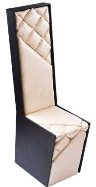
三越銀座店先行販売 <OGATA Inc.> HighBack Chair Champagne Gold 345,600円 ■8階 インテリア

シャンパンゴールドが目を引く張地は国外でも人気の、日本の織物技術を用いた<HOSOO>のテキスタイル。日本のモノ作りの革新的な融合です。