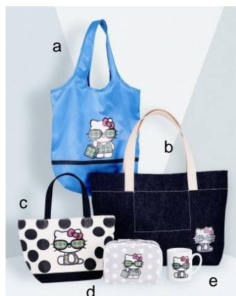
<ハローキティ×マクミラン/イセタン> a. ショッピングバッグ 3,240円 b. デニムトートバッグ 12,960円 c. トートバッグ 4,320円 d. ポーチ 3,780円 e. マグカップ 2,160円

©1976,2015 SANRIO CO.,LTD. APPROVAL NO.S555548 ■すべて 本館2階センターパーク/ザ・ステージ#2