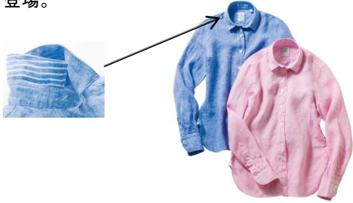
三越銀座店限定 <フィナモレ>シャツ 各34,560円 ■5階 銀座スタイル アディクションアリー

リネンながら格別に柔らかい生地を独自ルートで仕入れるブランドから襟裏にストライプを使用したシャツが登場。