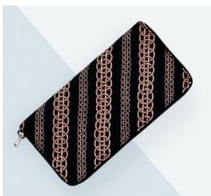
伊勢丹新宿本店先行販売 <浅草前川印傳>長財布 25,920円 ■本館5階ウエストパーク

伊勢丹が保存してきた伊勢型紙のなかから吉祥紋様といわれる「和繋ぎ」を選び、印傳に採用しました。ピンクの他、ブルー、イエローもあります。