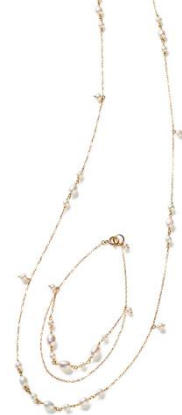
三越銀座店限定 <フェスタリア ビジュソフィア> ネックレス&ブレスレットセット 56,160円 ■地下1階 アクセサリー

柔らかく優しい印象をもたらす淡水パールのアクセサリは春の軽やかな装いに好相性。デイリー使いにぴったりです。