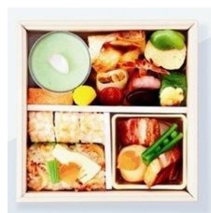
伊勢丹新宿本店限定 <なだ万厨房>春風の贈り物 各日10点限り 2,484円(1折) ■本館地下1階旨の膳

<なだ万>の若き調理長、河合寛氏が伝統と革新、手作りをテーマにお弁当をクリエイション。伝統の味と新しい料理が融合した、ひと品ひと品に工夫を凝らしたお弁当です。