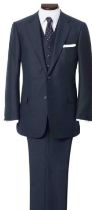
三越銀座店限定 <リッドテラー>メジャーメイドツーピース スーツ 106,920円から 素材各種 ■7階 メジャーメイド

若き日にモッズスタイルに親しんだ根本修氏監修によるブランドが三越銀座店に初登場。“ソフトテーラリング”といわれる、着用者の肩傾斜に近いショルダーラインを備える氏のスーツは「英国由来の普遍性」が漂います。