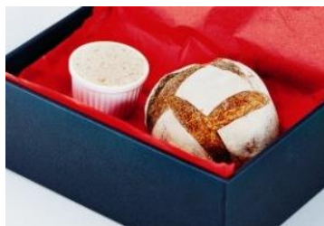
伊勢丹新宿本店限定 <アラジン> × <デュヌ・ラルテ> プレジール 2,160円 ■本館地下1階デリ エ ブーランジュリー

広尾のフレンチレストラン<アラジン>と、表参道のブーランジュリー<デュヌ・ラルテ>のコラボレーションボックス。伝統のリエットに特製カンパーニュを合わせました。