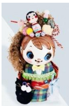
<コケッツ> こけし 5,940円