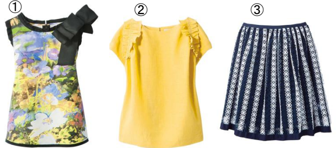
三越銀座店限定 <ランパンオン ブルー> ①花柄ブラウス 29,160円 ②ブラウス 19,400円 ③レーススカート 28,080円 ■3階 G-スペース

水彩画プリントが目を引くブラウスやフリル使いが可憐な一着、レースをあしらったスカートなど、多彩な限定品がお目見え。