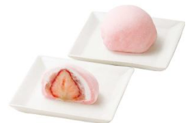
三越銀座店限定 <養老軒>丹波さくら餡 生いちご大福 1個【各日300点限り】432円 ■地下2階 ギンザスイーツパーク

桜の香りが広がる粒あんと生クリーム、徳島県産のももいちごを丸ごと1個包み込んだ、ボリューム満点の大福です。