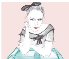
hip BORN twin

NEW! TOKYO DREAM CLOUD あなたの夢をクリエイターが叶えてくれるかも