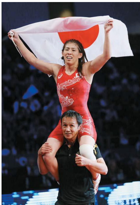
「優勝した吉田」世界レスリング女子53キロ級で優勝した吉田沙保里(上)。 (9月9日:米・ネバダ州ラスベガス)

本展では、今年を象徴する話題を中心に東京写真記者協会(新聞・通信・放送<NHK>33社)による決定的瞬間をとらえた写真約300点を一堂に展覧いたします。