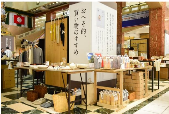
※画像はイメージです (2015年9月に開催したときのものです)