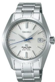
<グランドセイコー>