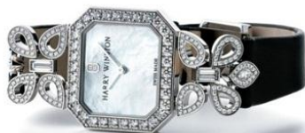
<ハリー・ウィンストン>