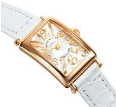
<フランク ミュラー>

本館1階中央ホールでは、「ウォッチランド ニューコレクションストーリー」と題して25日(月)までウォッチランドグループのフランク ミュラー、ボックス & ストラウスを特集。8月20日(水)一斉発売となるフランク ミュラーの話題の新作や、約60色以上のカラーダイヤモンド225個に10種類のカットを施した、410,400,000円(税込)のボックス&ストラウスのユニークピースなどをご紹介します。