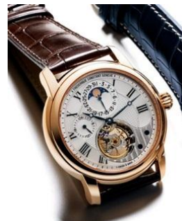
<フレデリック・コンスタント>