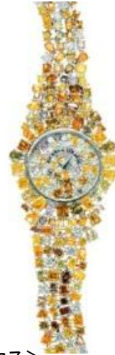
<ボックス & ストラウス>