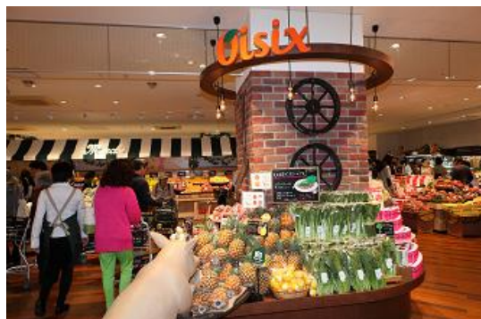
クイーンズ伊勢丹石神井公園店 オイシックスコーナーの様子