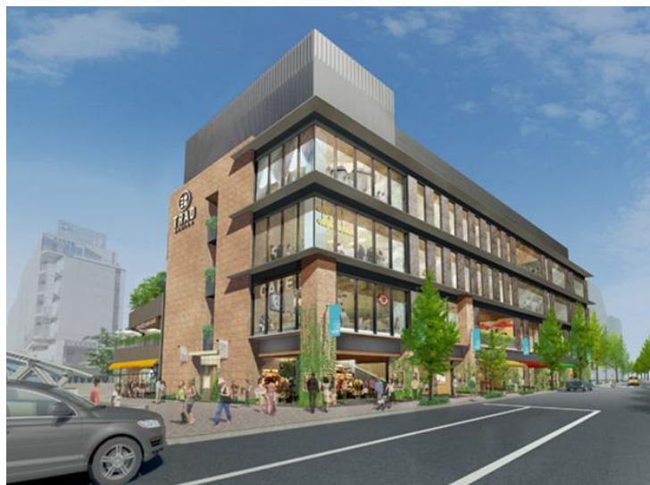
目白駅前から見た外観パース(イメージCG)

(株)三越伊勢丹ホールディングス 業務本部総務部コーポレートコミュニケーション担当 広報 TEL:03-6205-6003 FAX:03-6205-6009