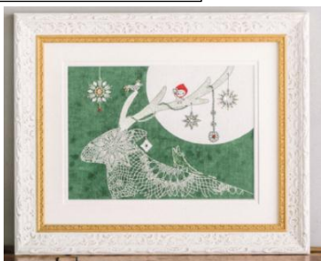
「クリスマスの前の夜」 165,240円