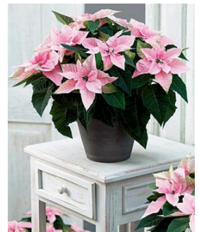
「プリンセチア」の鉢植え