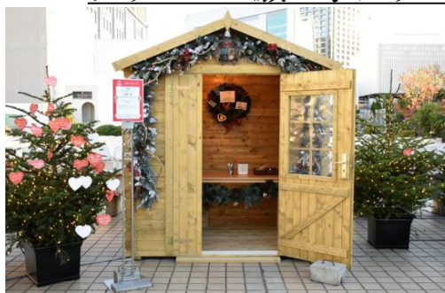
屋上のログハウスと願い事ツリー