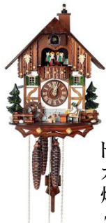
ドイツ カックー時計 煙突掃除屋さん 73,116円