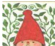
三越のクリスマスメインビジュアル：イラストレーター ジュナイダ氏