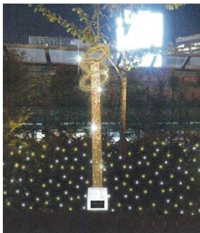
※ヒカリミチタワー:1月31日(土)まで

銀座通り1丁目から8丁目、及び晴海通りをシャンパンゴールドの光で彩る「GINZA ILLUMINATION ヒカリミチ2014」に合わせて、12月3日(水)から、テラスガーデンもライトアップ。ヒカリミチにも植えられているピンクの可愛い「プリンセチア」の花々とイルミネーションによる華やかで幻想的な世界をご堪能ください。