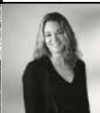
伊勢丹のクリスマス サブビジュアル