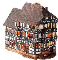
リトアニア キャンドルハウス 12,960円