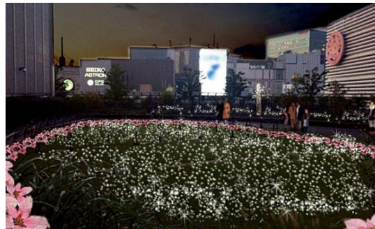
「プリンセチア」の花々とイルミネーション