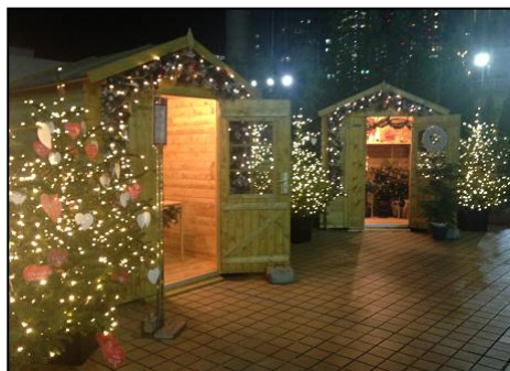
屋上のログハウスと願い事ツリー