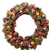
オーストリア ベリスパイスリースM 7,560円