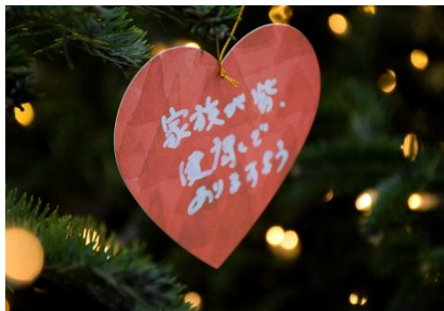
願い事ツリーとハート型ウィッシュカード