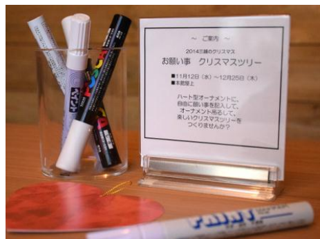
ハート型ウィッシュカード

この冬、三越日本橋本店の屋上チェルシーガーデンが美しくクリスマスイルミネーションで彩られました。ハート型のウィッシュカードに、クリスマスの願いごとを書いて、吊るしてみませんか。星空の下、あなたの書いたハートの願い事カードがクリスマスまで、ツリーに飾られます。ログハウスでは、リースやオーナメント(雪の結晶・月と妖精・トナカイなど、108円～)の展示販売もしています。