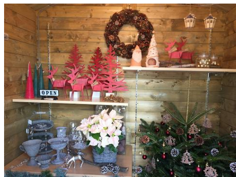
屋上のログハウス内グッズ展示販売