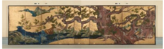
国宝「檜図屏風」狩野永徳作 安土桃山時代 16世紀

高精細複製展示協力:バンクオブアメリカ・メリルリンチ文化財保護プロジェクト ※2月17日(火)～3月15日(日)は、実物の国宝「檜図屏風」が東京国立博物館で公開されます。