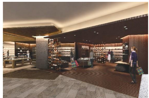
和食器(特選)／茶道具(イメージ)

日本人になじみ深い茶道具の専門コーナー。これまでの格式的な茶道とは一線を画し、「形式にとらわれない自由なお茶の楽しみ方」をご提案。おもてなしカウンターも常設し、ワークショップも開催します。