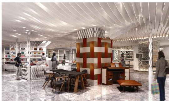
センターパーク(イメージ)

新進気鋭のクリエイターや、国内では手に入りにくいアイテムなど、伊勢丹独自の企画を発信するパークのメインエリアです。