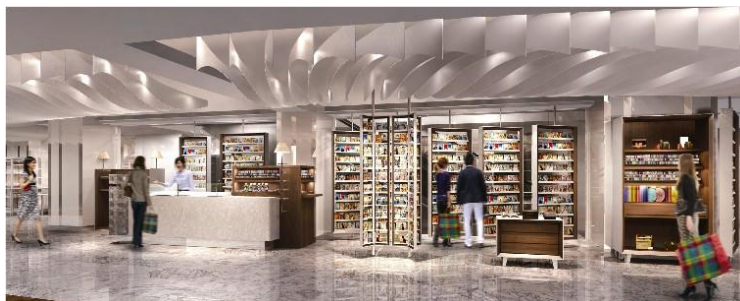
イーストパーク (イメージ)

イーストパークのひとつの「IYASHI」では、「自然の恵みを暮らしに活かす」をコンセプトに、天然素材にこだわった「ババダグーリ」のアイテムを展開。メッセージカードの専門コーナーでは500種類以上のカードを常備し、その場で切手を貼り、店内に設置のポストに投函もできます。