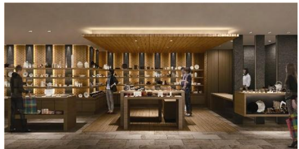
プロモーション(和食器) (イメージ)

話題のキュレーターやコーディネーターによる、企画展、グループ展を開催します。人気作家の作品を展開し、お気に入りの作家の作品に出会える場をご提案。次代のクリエイターを育てる「器の解放区」をめざします。