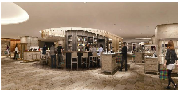
ワイン用品・コーヒー用品(イメージ)

「ワイン&リカー」、「コーヒー&ティー」の2つの切り口で展開。ワイン用品コーナーにはソムリエやワインアドバイザーなどの有資格者が常駐し、おすすめのワインを試飲(有料)していただきながら、それに適したワイングラスのアドバイスを行ないます。コーヒー用品のコーナーでは、様々なコーヒー店のバリスタによるドリンクの提供(有料)や、こだわりのコーヒー豆はもちろん、おいしく飲むための淹れ方までご紹介いたします。