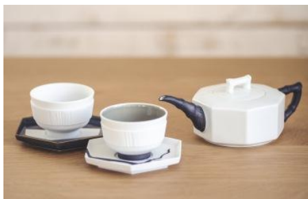
<深川製磁> 特別ティーセット 10セット限り 108,000円

14代今泉今右衛門をはじめ日本を代表する作家や、伊勢丹が注目する新進気鋭の作家の作品を常設にてご紹介します。また、国内外で活躍する作家や工房を週替わりでご紹介し、逸品作品や作家に出会える喜びやご満足をお届けします。