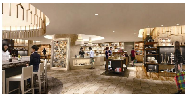
キッチン用品(イメージ)

「食」を楽しむための上質なツールが揃う、機能×デザインのアイテムを集積した編集ショップ。生活の中心となる「食」をもっとこだわりたい、楽しみたいという方へ、定番の調理器具からプロフェッショナル仕様の道具まで、料理を充実させるツールを集めました。合わせて、名だたるシェフ・料理などの専門家がキッチンの道具を説明しながら調理し、その技を味わい・体感できる「キッチンスタジオ」を新設します。