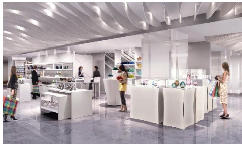
ウエストパーク(イメージ)

希少性の高い工芸品を、圧倒的なバリエーションをもって紹介する独自編集ショップ。国内外の作家、アーティスト、工房などが手がける、魅力的な暮らしのアイテムが数多く揃います。