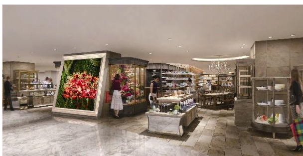
キッチンダイニングデコール(イメージ)

季節感を大切にしながら、時にビオワインやガラス作家のグラスなども紹介し、心地良さや温もりをシェアすることを楽しむ集いのスタイルを提案。