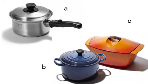
(a) <ビタクラフト>インフィニティ 片手鍋 34, 560円 (b) <ル・クルーゼ> シグニチャー ココット・ロンド 22cm 38, 880円 (c) <ル・クルーゼ> コケル 28cm オレンジ 64, 800円

キッチンのなかで使う用品の集積コーナー。伊勢丹新宿本店限定のステンレス鍋やフライパンをご提案します。包丁は、高品質でベーシックな、日本のモノ作りを代表する逸品をはじめ、伊勢丹限定の定番品、コレクションとしての品揃えです。