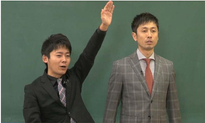
この中でロボットを作ったことがある人