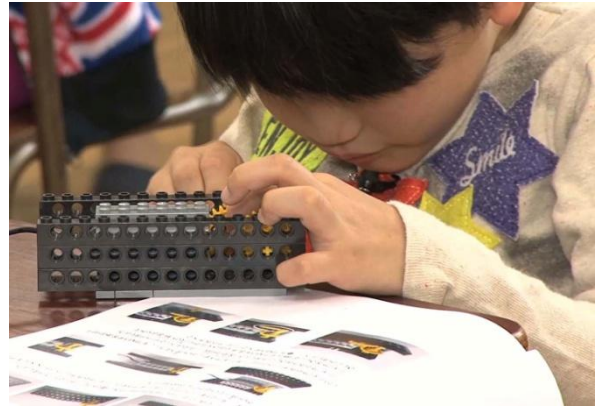
子どもたちの作る時の集中力はすごいものが