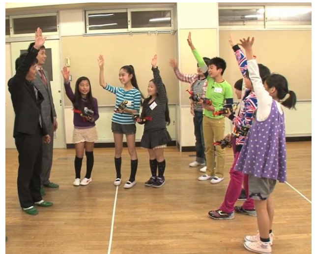
「楽しかった人、手を挙げて！」。失敗も含め、みんな楽しんだ様子