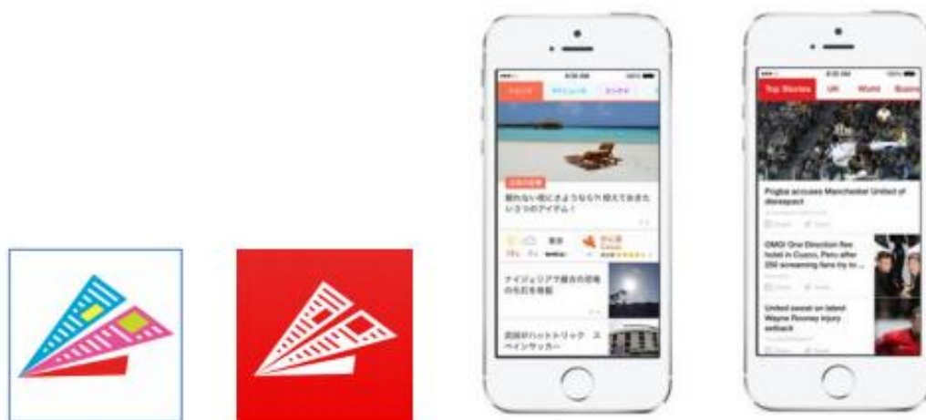
画像 : 左から順に「国内版アプリアイコン」、「海外版アプリアイコン」、「国内版画面」、「海外版画面」