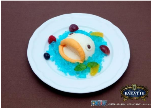
バラティエ特製 洋梨のムース サバガシラ仕立て

メニューでは、サバガシラをイメージしたデザート“バラティエ特製 洋梨のムース サバガシラ仕立て”[800 円(税込)]をご用意しました。こちらをご注文されたお客様には、サバガシラを被ったサンジが描かれている限定の“サンジのバラティエオリジナルブロマイド”をプレゼントいたします。※ブロマイドはなくなり次第終了します。