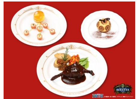
特別ディナーセット (左から)前菜、メイン、デザート