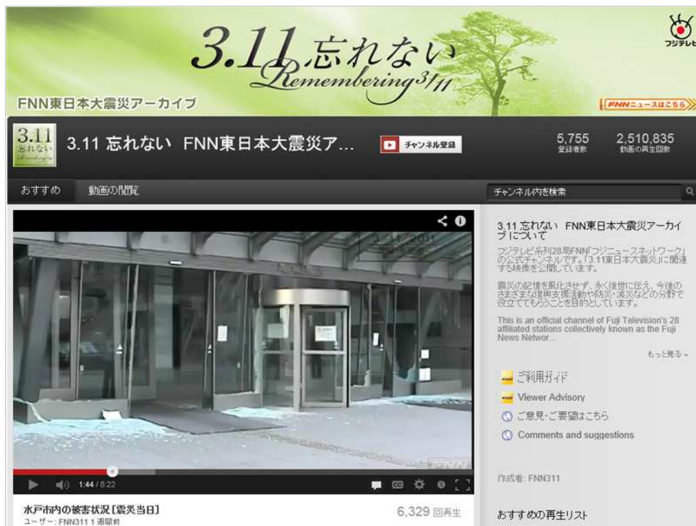
『3.11 忘れない ～FNN 東日本大震災アーカイブ～』 サイト画面(PC)