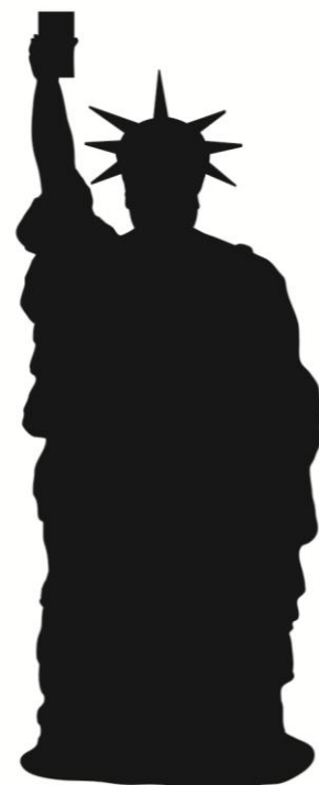
※氷の女神(パケコ・デラックス)像イメージ