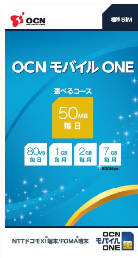
(図1)パッケージイメージ