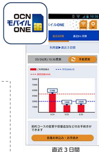
(図2)アプリ画面イメージ

*1 MM総研調査「国内MVNO市場規模の推移・予測(独自サービス型SIMシェア (2014.6.10))