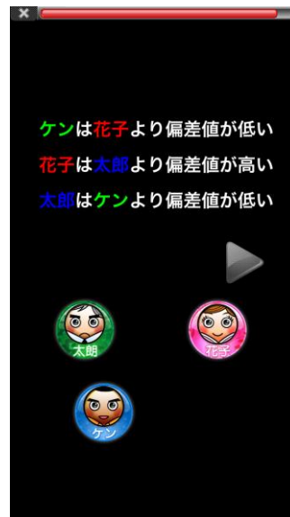
トレーニング「比べる文章」