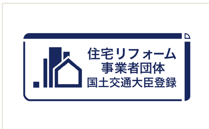
▲登録住宅リフォーム事業者団体のロゴマーク

一般社団法人リノベーション住宅推進協議会（東京都渋谷区・会長 内山博文、会員総数 545 社、正会員 387 社、賛助会員 142 社、特別会員 4 名 9 法人 3 自治体）は、4 月 16 日（木）に、国土交通省「住宅リフォーム事業者団体登録制度（2014 年 国土交通省告示第 877 号）」の住宅リフォーム事業者団体として登録されました。