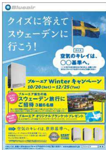
Winter キャンペーンイメージ

本キャンペーンを通じて、“世界基準の高性能空気清浄機 ブルーエア”に対する一般生活者の接触機会を増やすことにより、更なるブランドの活性化に努めてまいりたいと考えております。