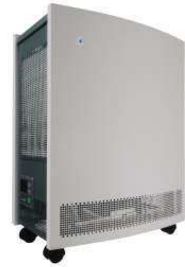
フラッグシップモデル ブルーエア 650E

ブルーエア社は、1996年の創業以来、空気清浄機の本質性能を追求している空気清浄機の専門メーカーです。空気清浄機に特化するブルーエア社はフィルターも独自で研究や開発をしています。ブルーエアは、粒子イオン化技術と高性能フィルター技術の融合である独自の特許技術※3「HEPA Silent®(ヘパサイレント)テクノロジー」により、これまで両立が難しかった「ハイスピード清浄」と「高い除去率」を実現しました。この技術により目詰まりを起こさず、大風量を保ちながら空気を清浄し続けることが可能です。その性能は、8畳をわずか2.5分※4というハイスピード清浄に加え、空気中に漂う0.1ミクロン以上の粒子を99.97%除去※5する高い除去能力を備えています。