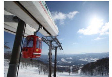
高鷲スノーパーク(岐阜県)