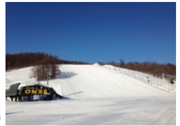
スノークルーズオーズ(北海道)