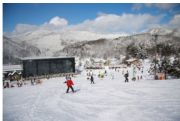
ユートピアサイオト(広島県)