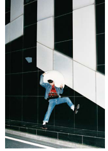
星野源「YELLOW MAGAZINE 2016-2017」表紙 (2017)