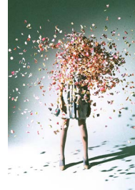
「GINZA」エンポリオ アルマーニ (2014)