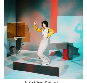
菅田将暉「PLAY」ジャケット写真 (2018)