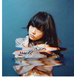
「日本経済新聞」あいみょん (2019)