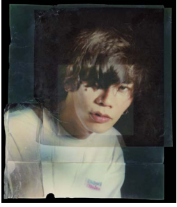
米津玄師 アーティスト写真 (2020)