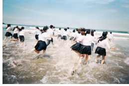
POCARI SWEAT 「踊る修学旅行」篇 (2017)