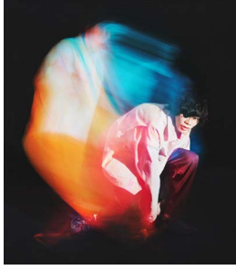
米津玄師 アーティスト写真 (2020)