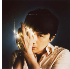
福山雅治「心音」ジャケット写真 (2020)