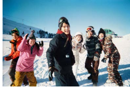
JR SKISKI 2019-2020 浜辺美波/岡田健史 (2019)