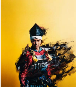
NHK大河ドラマ『麒麟がくる』メインビジュアル (2020)