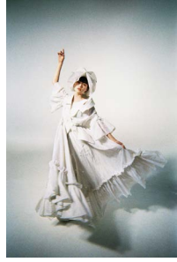
ANREALAGE 「HOME」 平手友梨奈 (2020)