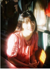
「週刊文春」広瀬すず (2019)