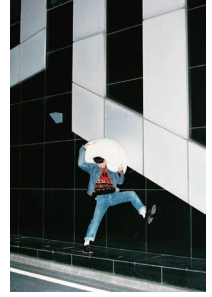
星野源「YELLOW MAGAZINE 2016-2017」表紙 (2017)