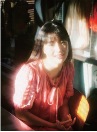
「週刊文春」広瀬すず (2019)