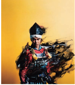
NHK大河ドラマ『麒麟がくる』メインビジュアル (2020)