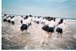
POCARI SWEAT 「踊る修学旅行」篇 (2017)