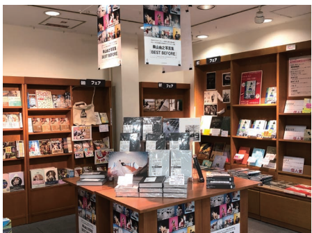
紀伊國屋書店新宿本店