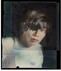
米津玄師 アーティスト写真 (2020)