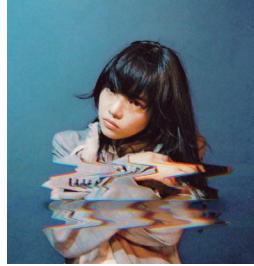
「日本経済新聞」あいみょん (2019)