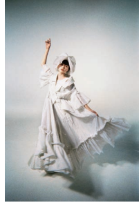
ANREALAGE 「HOME」 平手友梨奈 (2020)