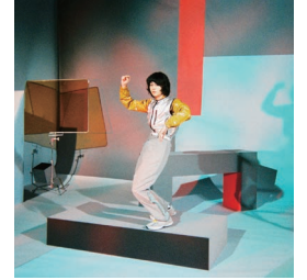
菅田将暉「PLAY」ジャケット写真 (2018)