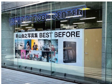
青山ブックセンター本店