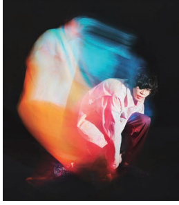
米津玄師 アーティスト写真 (2020)