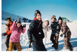
JR SKISKI 2019-2020 浜辺美波/岡田健史 (2019)