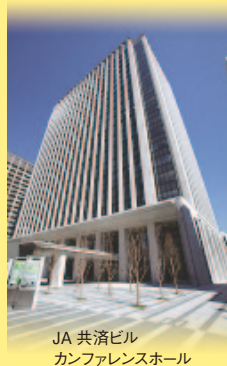
JA 共済ビル カンファレンスホール