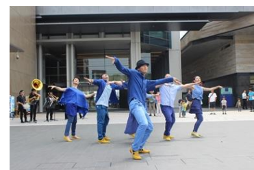
※画像は、2016年6月に開催したForever Dancingです。

毎時ちょうどに音楽が鳴り響き、登場するのは12名の人形たち。ガレリアのクリスマスツリー周辺で始まる、精巧でファンタジックなショートパフォーマンスにご期待ください。