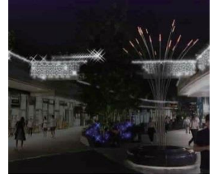
※画像は、イメージです。

“光の散歩道”をテーマに、テラスマーケット・リボンストリートから中央広場周辺までのエリアが、イルミネーションに彩られます。きらめく光の軌跡をたどれば、まるで冬の夜空を散歩しているような気分。ロマンティックなニ子玉川の冬をお楽しみください。