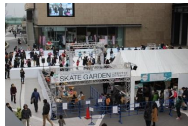
※画像は、昨年の様子です。

今年もニ子玉川ライズ中央広場に、広さ390㎡の本格的なアイススケートリンクが設置されます。イルミネーションに囲まれた空間で、大人から子供まで楽しく滑ることができるスケートガーデンです。12月21日(水)からオープンしますので、ぜひ買い物やお食事の際にお立ち寄りください。