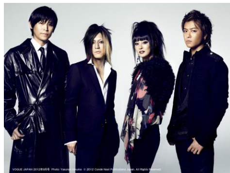
VOGUE JAPAN 2012年9月号

http://itunes.apple.com/jp/app/vogue-japan/id383088579?mt=8