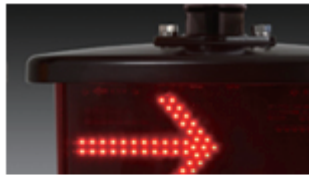
踏切警報灯/列車進行方... 東邦電機工業株式会社