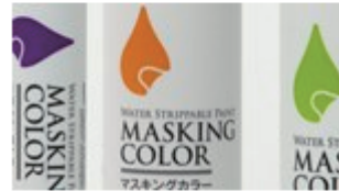
水性塗料 太洋塗料株式会社