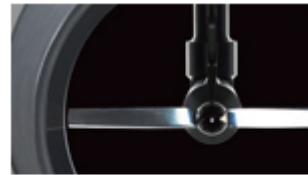
小型水力発電機 株式会社茨城製作所