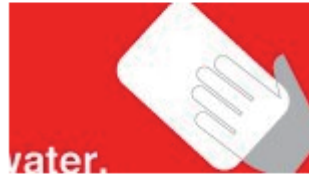
イマバリレスキュータ... 宮崎タオル株式会社