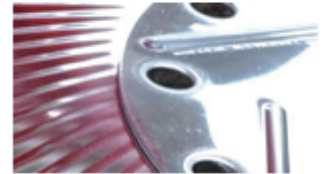
刈り払い機用回転刃 株式会社富田刃物