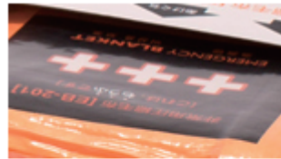
非常用圧縮毛布 足立織物株式会社