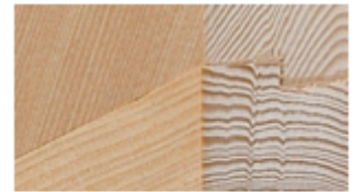
制震ダンパー 株式会社欧倫ホーム