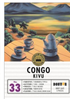
ドリップカフェ 5袋入