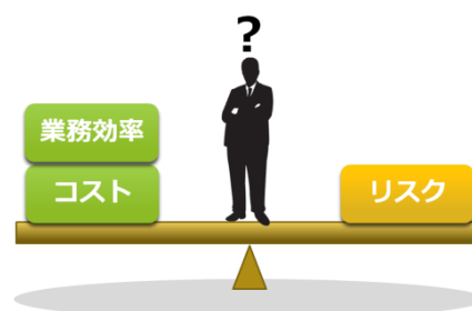
図1: 企業における課題

今企業で求められているのは、「営業秘密」、「情報セキュリティ」、「人材マネジメント」という3領域を俯瞰し、かつ統合的な観点で管理体制を構築し、戦略的観点から企業がもつ営業秘密を適切に守り、活用するための組織横断的なマネジメントスキルを持つ人材を育成し、経営を推進していくことです(図2)。