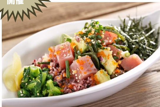
ハワイ本店のレシピを忠実に再現した ポキボウル