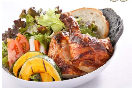
リリコイソースを使ったフリフリチキン

2013年、東京青山に上陸したアイランドヴィンテージコーヒー。 待望の2店舗目の出店が決定致しました。