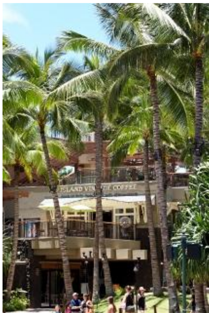
※ロイヤルハワイアンSC店

場所は表参道のメインストリート、ハワイからのパンケーキ店などが集まる場所です。 そして、1号店の青山店では自慢の100%ハワイアンコーヒーをハンドドリップで味わえるサービスもスタート。 表参道店はもちろん、青山店もこの機会にご利用ください。