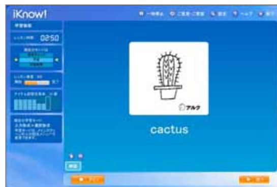
< 「iKnow!」学習ページ:画像 >

書籍『アルク 2000 語絵じてん』は、アルクが選んだ、12歳までにおぼえておきたい「アルク児童語彙 2000 語」を、家、学校、街、山、海など、子どもに身近な 63 の場所や場面とともに掲載した語彙集です。2000 語のほとんどをイラスト化し、絵で表すのが難しいものについては、セリフや索引内の例文の形で掲載。付属の CD には、ページを開き、聞きながら子供が一緒に単語を指差したり考えたりできるように、各場面を紹介するネイティブスピーカーによるダイアログや、絵じてんのテーマに沿った楽しいオリジナルの歌、リズムカルなチャンツ、単語のナレーションなどを収録しており、2000 年の発売以来、多くの皆様に愛用されています。