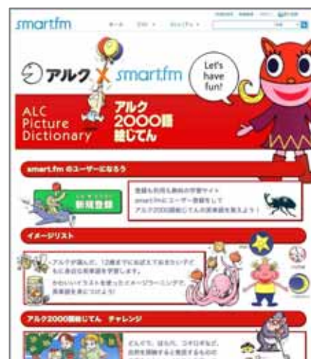
< 特設ページ:画像 >

英語学習コンテンツ「子ども英語」では、子どもをはじめ、保護者、指導者らが英語を楽しく学べるアイテムを今後も提供していきます。