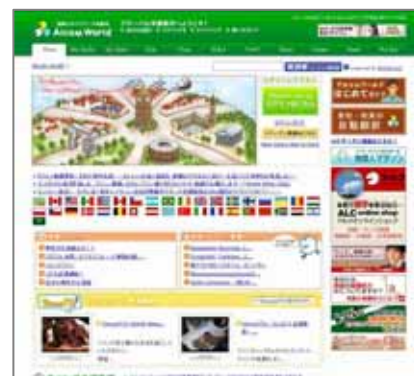
<「Alcom World: トップ」ページ>