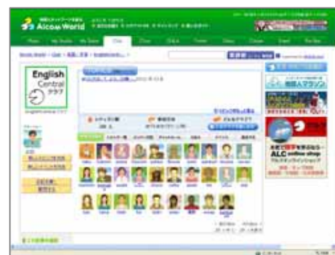
<「Alcom World: EnglishCentral クラブ」ページ>

Alcom World 登録サイト http://alcom.alc.co.jp/