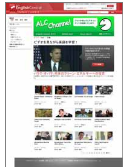
< 「EnglishCentral: ALC Channel」ページ >

今後とも無料ユーザーにもご満足いただけるような様々なサービスをご提供すると共に、年明けに有料でより多くのコンテンツと充実したサービスをご提供していく予定です。