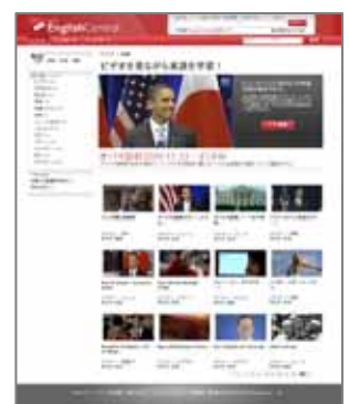
< 「EnglishCentral: トップ」ページ >