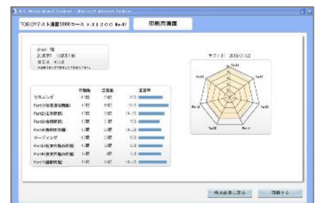
<受験結果印刷画面>

○印刷機能: 提出課題として、また学習者自身の受験記録として、テスト結果を印刷することが可能です。