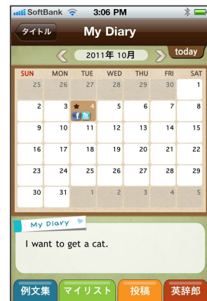
My Diary カレンダー画面