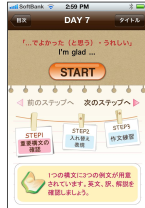
英語日記ドリル 学習開始画面

『アルク英語レスキュー・シリーズ Vol.1 1日1行でもOK! 英語日記ドリル』 (アルク刊)