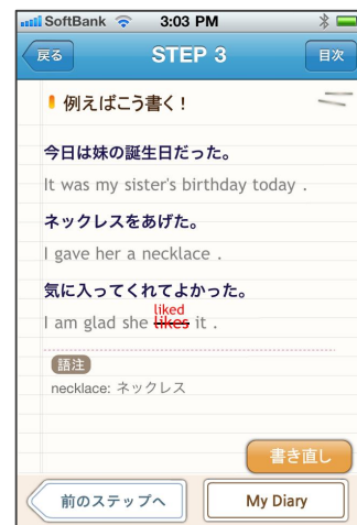
STEP 3 画面