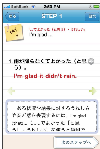
STEP 1 画面

1つの構文につき、3つの例文(音声付き)を用意。構文の意味や使い方の解説付きです。