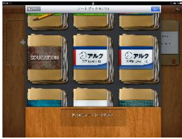
Peek 日本語公式コンテンツ として登場！