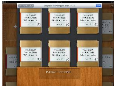
Peek 日本語公式コンテンツ 最多の、24個のコンテンツを提供！