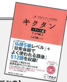
【既刊書】 『キクタン フランス語【入門編】 仏検5級レベル』