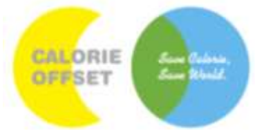
カロリーオフセット ロゴマーク

この度、日本発、世界の食料問題の解決に取り組む NPO 法人 TABLE FOR TWO International（東京都港区、代表 小暮 真久 以下、TFT）は新プログラム「カロリーオフセット」を本格始動し、様々な企業が新たに参画し、対象商品の販売やイベントを実施します。カロリーオフセットは、「SAVE CALORIE, SAVE WORLD～あなたがオフしたカロリーが、誰かのカロリーになる～」をスローガンに、先進国の余分なカロリーを開発途上国で必要なカロリーに変換する日本初のプログラムです。