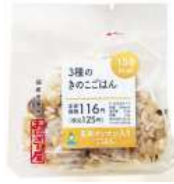
玄米マンナン入り 3種のきのこごはん