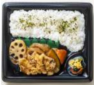
野菜と茹で豚の生姜あん弁当