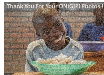
投稿された写真を用いたモザイクアート