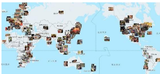
投稿が5,000枚を超えた際のグローバルマップ