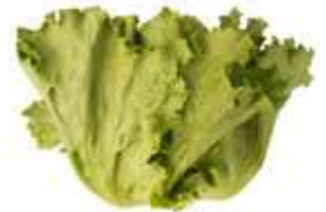
▼まかない高原レタス

見た目は良くなくとも、安全性や味は通常の商品と変わらないことや、採れすぎってしまった事情、生産者の声などをページでお客様に詳細に説明できるという EC サイトの強みをいかしています。「ふぞろい」、「たくとれ」の野菜、果物は常時 20 品前後販売しています。