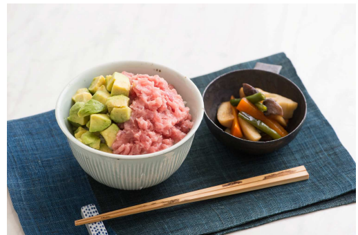
▲冷凍キット「マグロとアボカド丼」と「和野菜の煮物」

冷凍キットにより、賞味期限が長くなるだけでなく、刺身などこれまでお届けできなかったメニューも可能になり、メニューのバリエーションがさらに広がります。