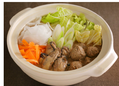
鍋レシピ最終候補のひとつ「来る美素(くるみそ)海鮮鍋」