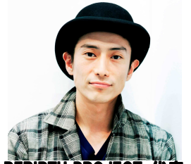
REBIRTH PROJECT 代表 伊勢谷友介氏