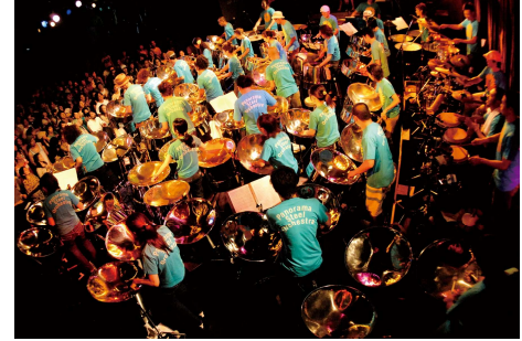
Panorama Steel Orchestra