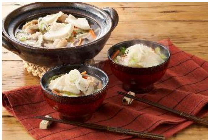
▲Kit Oisix「ほっこりおだしの八戸せんべい汁」

企画の経緯～まちおこしイベント「B-1グランプリ」が開催延期、ご当地グルメをお届けするために～