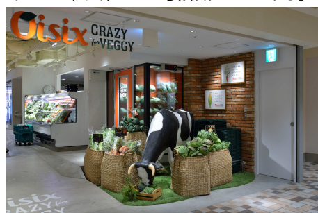
牛がお客様をお出迎え。 「動物も恋焦がれる野菜」の表現。