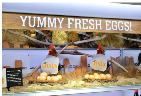
卵を取ると「コケコッコー」と鳴く仕掛け。 卵が鶏から生まれることを お子さんにも知ってほしい。