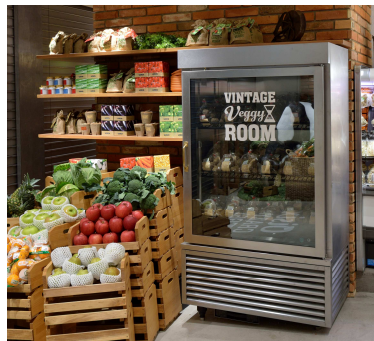
低温で暗く、貯蔵時の環境と近い “ヴィンテージベジブルーム”