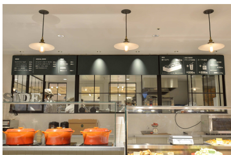
初展開のデリコーナー。 持ち帰りはもちろん、 ランチやお茶としても活用いただける。