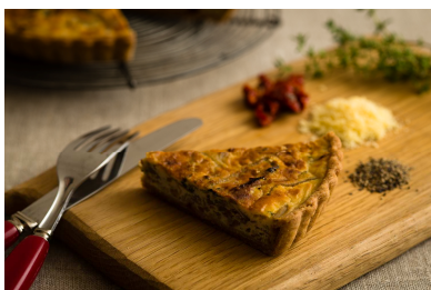
春菊と雑穀の和風キッシュ 単品：398円（1ピース）