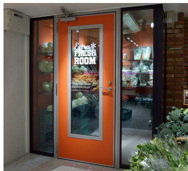
葉ものを中心に販売する “エクストラフレッシュルーム”

野菜の美味しさを味わうことを考えた、野菜が主役の“デリ”を初展開し、20席以上のイートインスペースもご用意しました。恵比寿店でも人気の「選べるサラダ」は、30種類程度の野菜から、10万通り以上の組み合わせで好みに合わせてご購入いただけます。