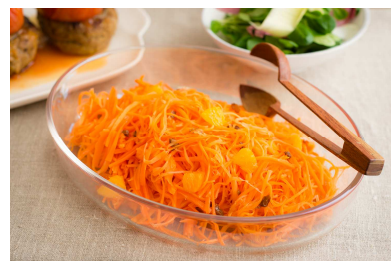
あまつ娘にんじんオレンジラベ 単品：298円（100g）