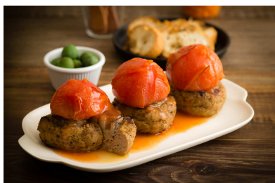
岩国れんこんと焼きトマトハンバーグ 単品：780円（1パック）