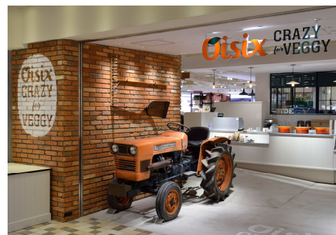
実際の農場で使われていた “トラクター”で産地とのつながりを実感