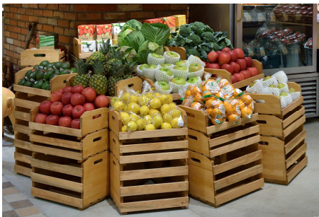
ECサイト「Oisix」で人気の 安心・安全な新鮮野菜や伝統野菜が 充実の200種類程度。