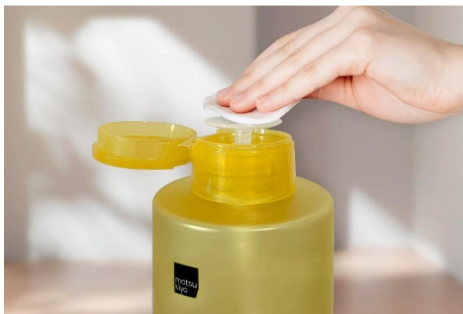
matsukiyo クレンジングウォーター コットンポンプボトル