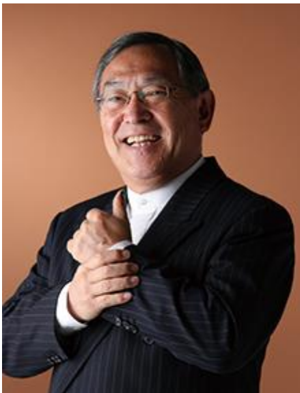
株式会社ビジネス・ブレークスルー 代表取締役社長 ビジネス・ブレークスルー大学 学長 大前 研一 氏