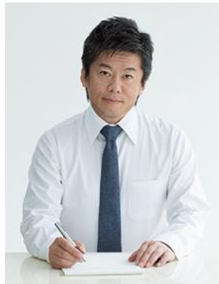
SNS 株式会社ファウンダー 堀江 貴文 氏