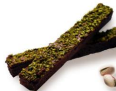
ピスタチオ (バレンタイン限定フレーバー)