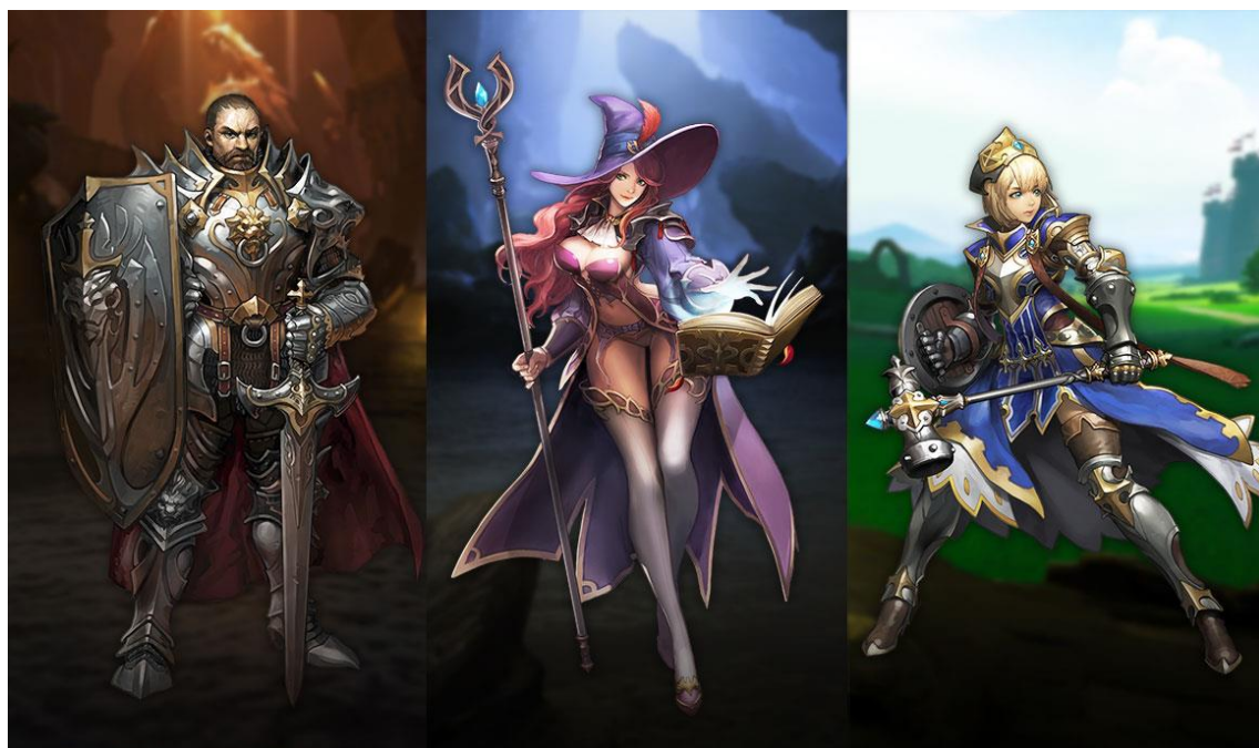
〈キャラクターイメージ〉