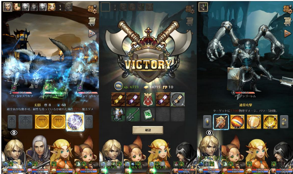
〈バトルプレイ画面〉