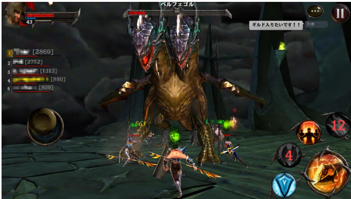
〈レイドボスのプレイ画面〉