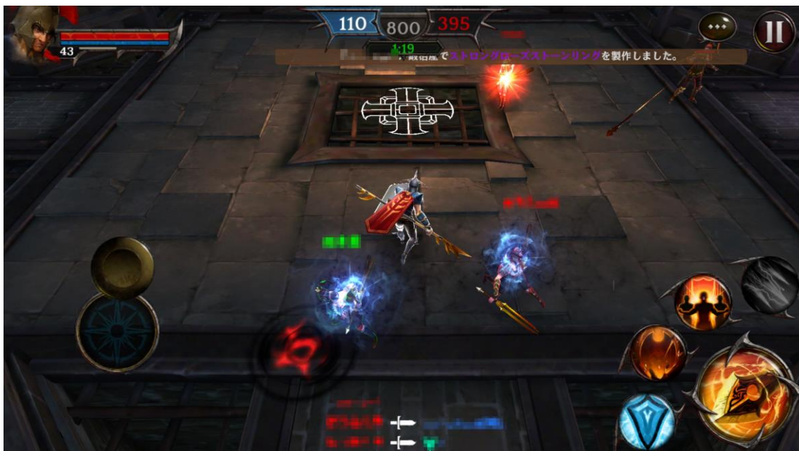
〈個人戦のプレイ画面〉