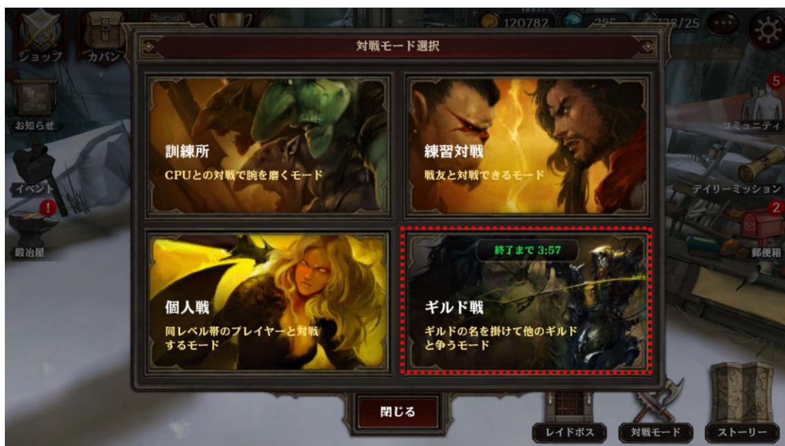
〈ギルド戦開催時の入場画面〉

ダークアベンジャー2 の醍醐味、リアルタイムで楽しめる対戦モードに新たな機能「ギルド戦」が公開されました。ギルド戦では、同じギルドメンバーが3人集まればランダムで対戦を希望中の他のギルドと自動的にマッチングされます。プレイ方法は個人戦と同じくリアルタイム3対3バトルです。