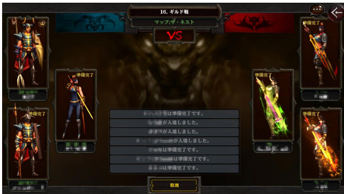
〈ギルド戦の開始画面〉