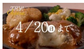
「4種類のチーズで美味しくなった」